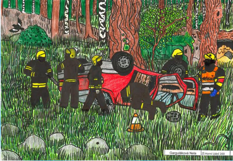
Garguláková Nela 125 Horní Lidčé 200