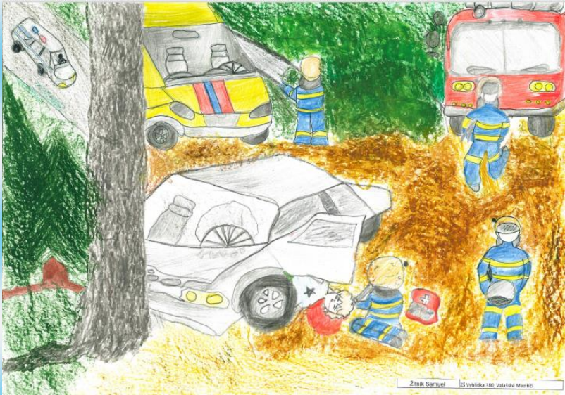
Zámek Samuel 125 Vynitka 180, Valtická Mašovice